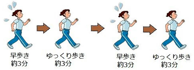
インターバル速歩とは 早歩きとゆっくり歩きを交互に繰り返して行うウォーキング方法

普通のウォーキングと比べ、体力が向上し、血圧、血糖値、中性脂肪、体脂肪といった生活習慣病に関わる指標の全てで改善することが確認されています。